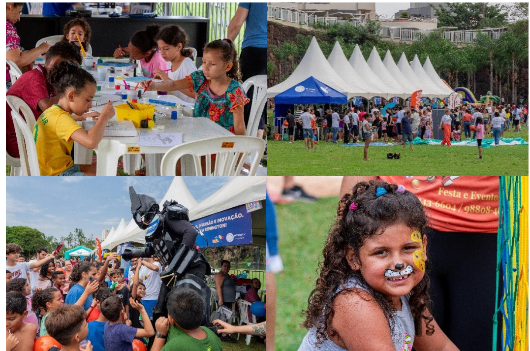
*Fotos do evento Mundo Criança 2023